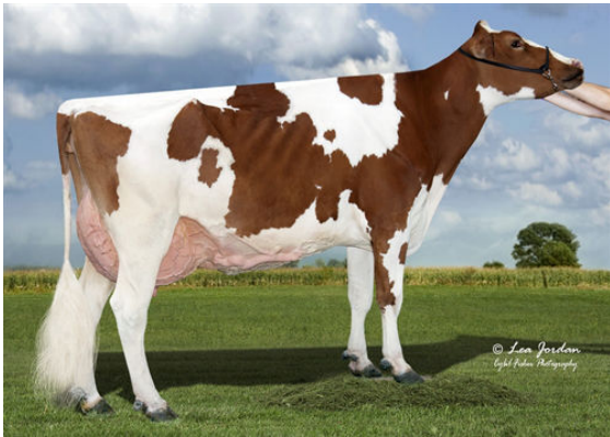
SCENERY-VIEW CELIA-RED FIFTH DAM